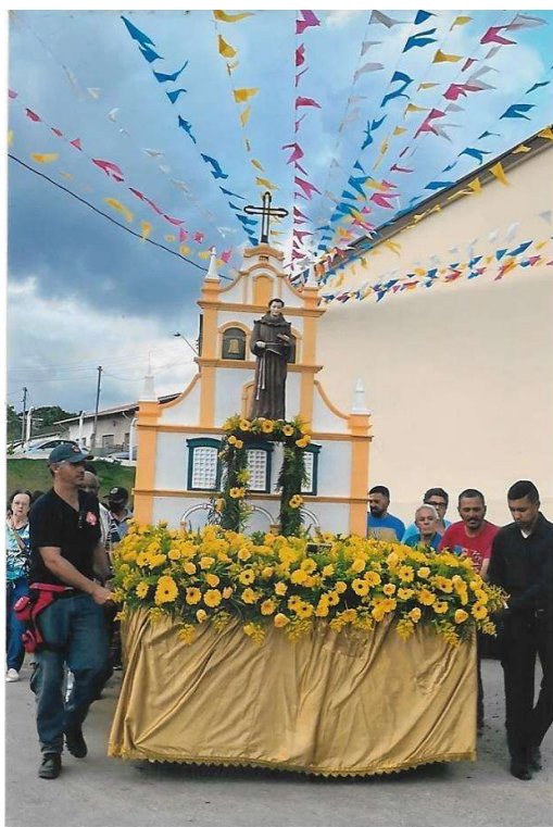
Andor de Frei Galvão ornamentado para a procissão, com Frei Galvão à frente do Mosteiro da Luz, local onde está sepultado.