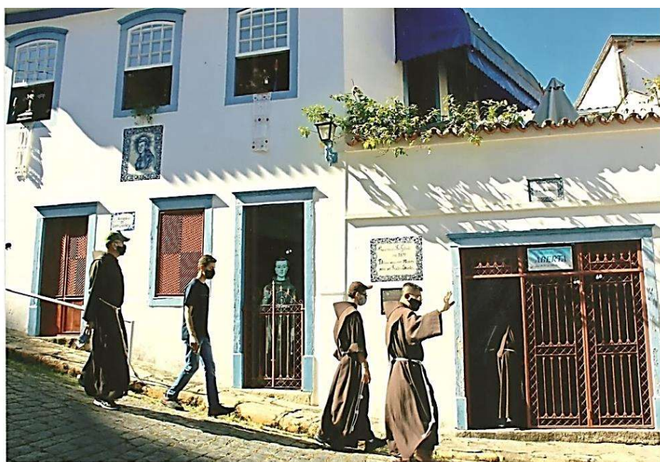
Frades Franciscanos chegam à Casa de Frei Galvão durante a caminhada para a posse do Santuário de Frei Galvão, 11 de abril de 2021.

O Museu Frei Galvão deseja ao Reitor e seus colaboradores que o Santuário se torne uma fonte de irradiação do Carisma Franciscano, com as bênçãos de Santo Antônio de Sant’Ana Galvão.