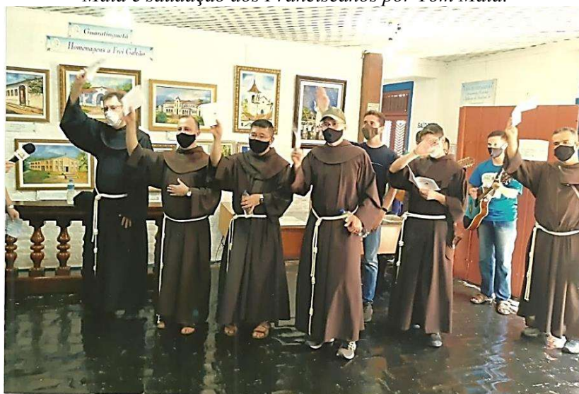
Hino a Frei Galvão, na Casa do Santo, após a bênção da família de Frei Galvão, em 11 de abril de 2021.