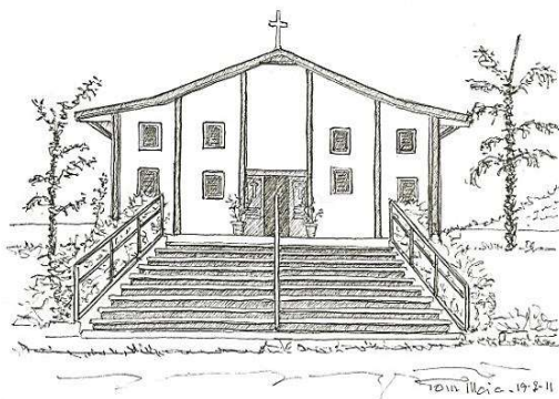
Santuário de Frei Galvão no Jardim do Vale - Guaratinguetá.

A Igreja foi erguida pela Comunidade em terreno doado por José Galvão Nogueira em 1987, tendo São José como Padroeiro. Em 1998, após a Beatificação de Frei Galvão, foi adequada e terminada a construção, sendo a Igreja de Frei Galvão. Em 11 de maio de 2007 Frei Galvão foi canonizado em São Paulo, pelo Papa Bento XVI.